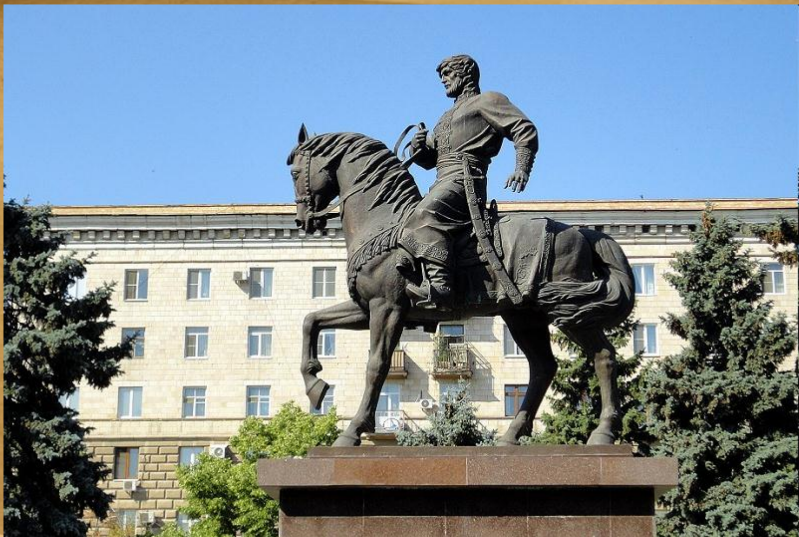
Памятник в Волгограде